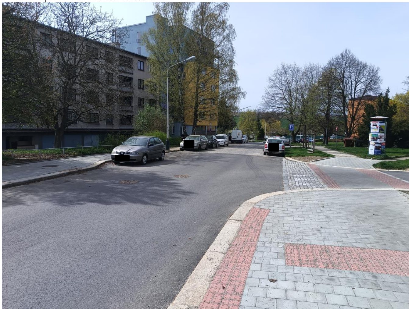
Pohled na prostor budoucích zastávek