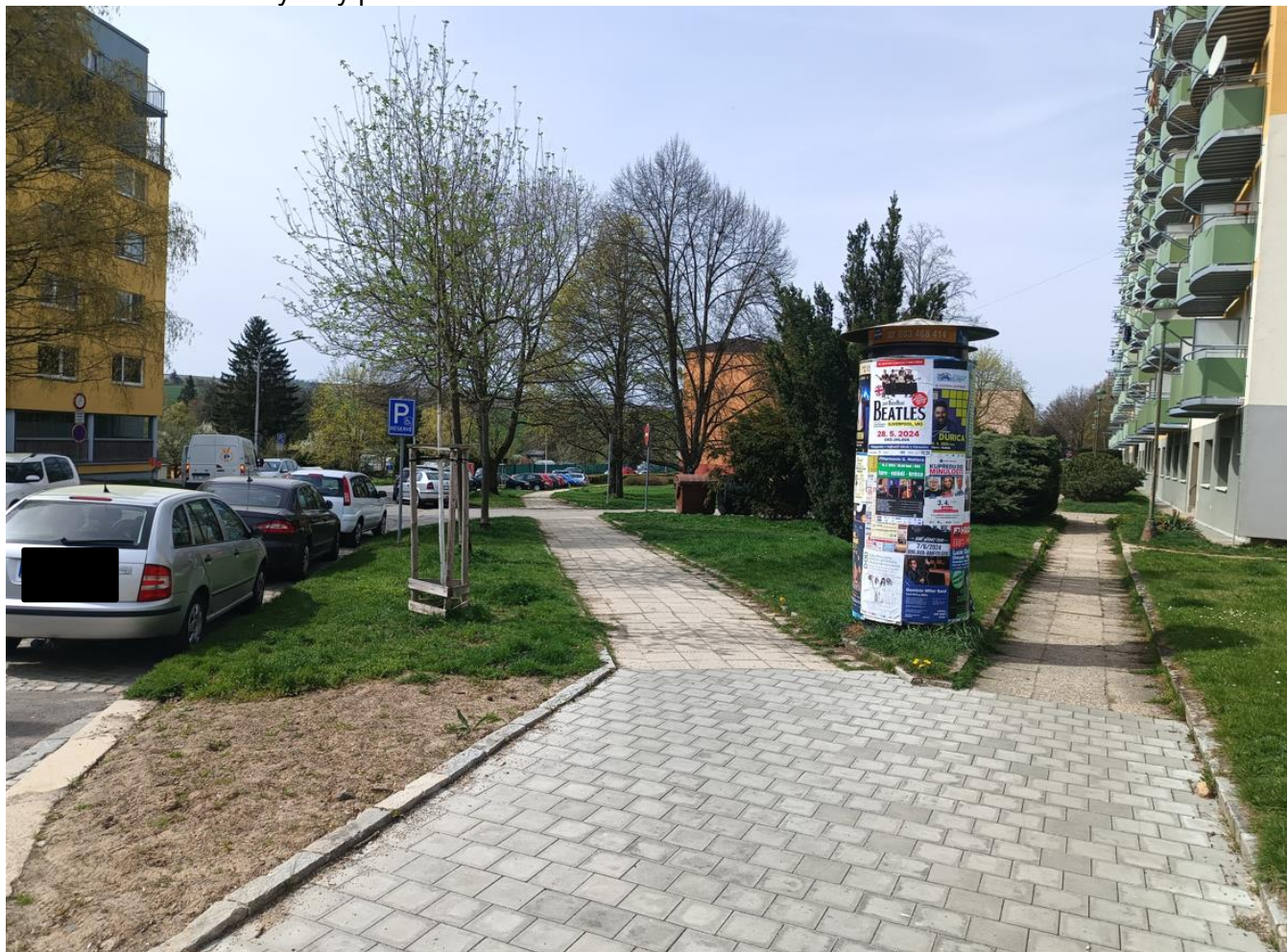
Stávající chodník (vlevo), který bude zrekonstruován