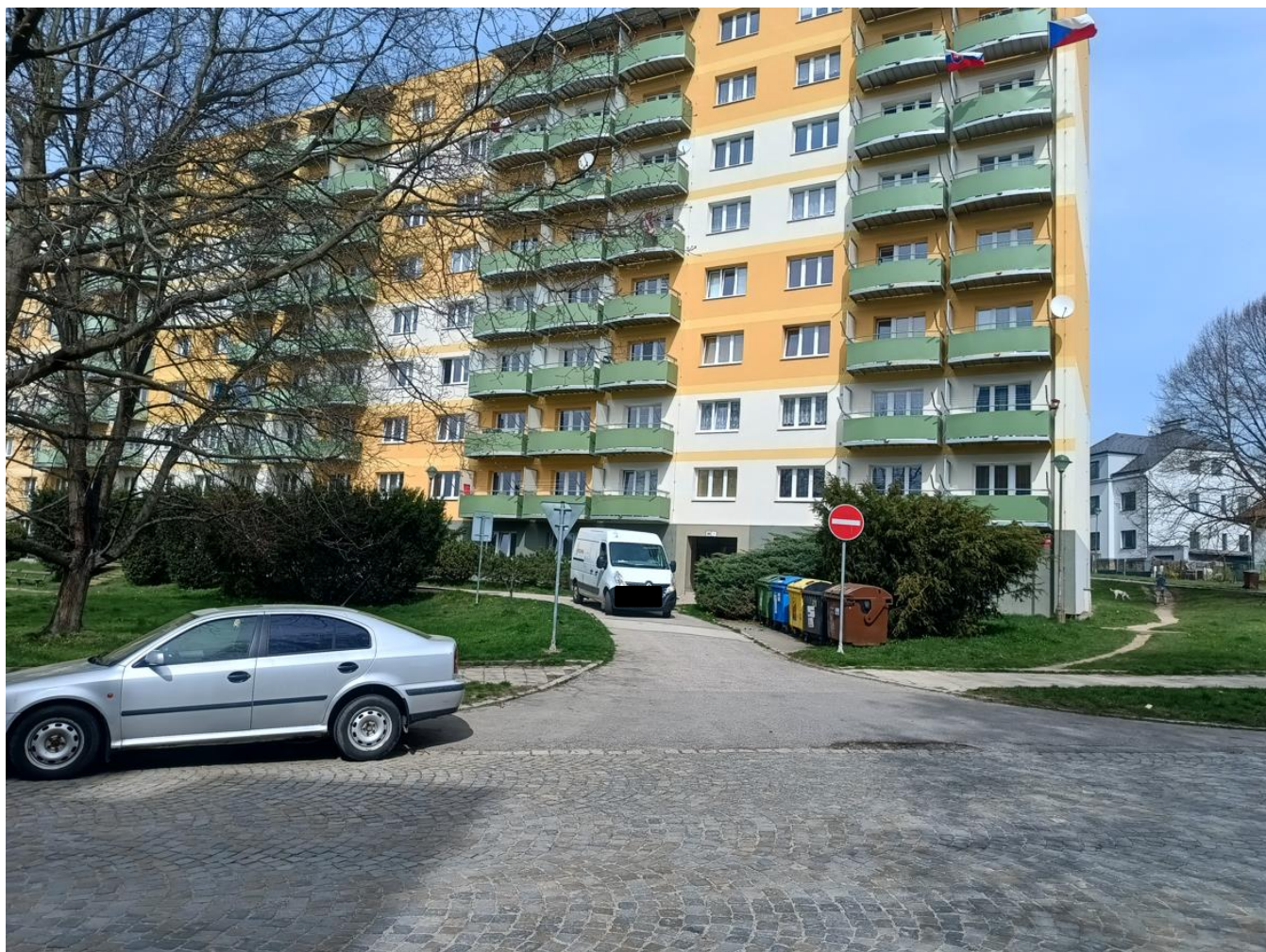
Pohled na budoucí zvýšený práh