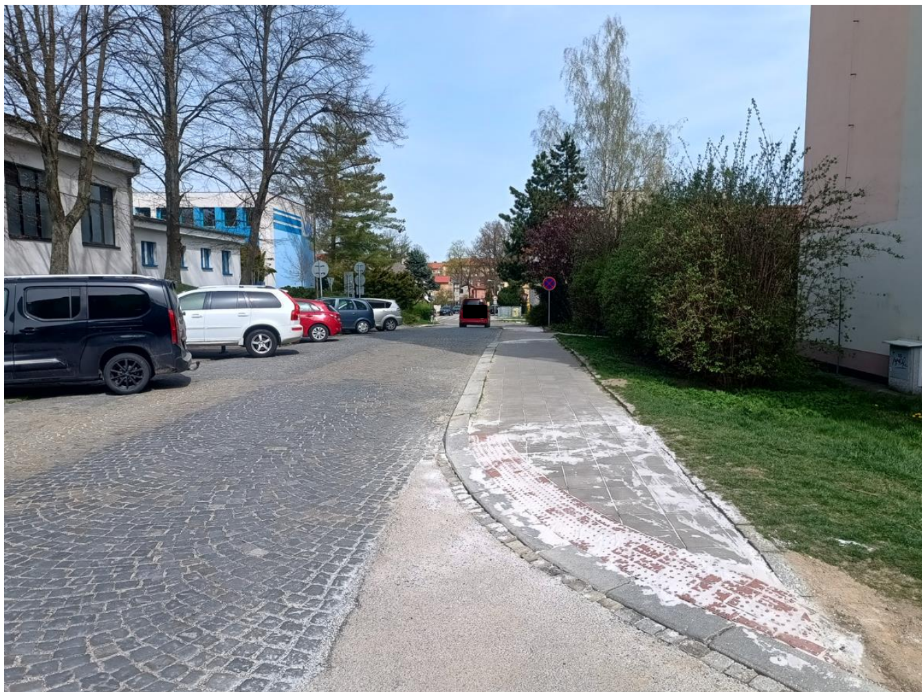
Pohled směrem k ul. Žižkova