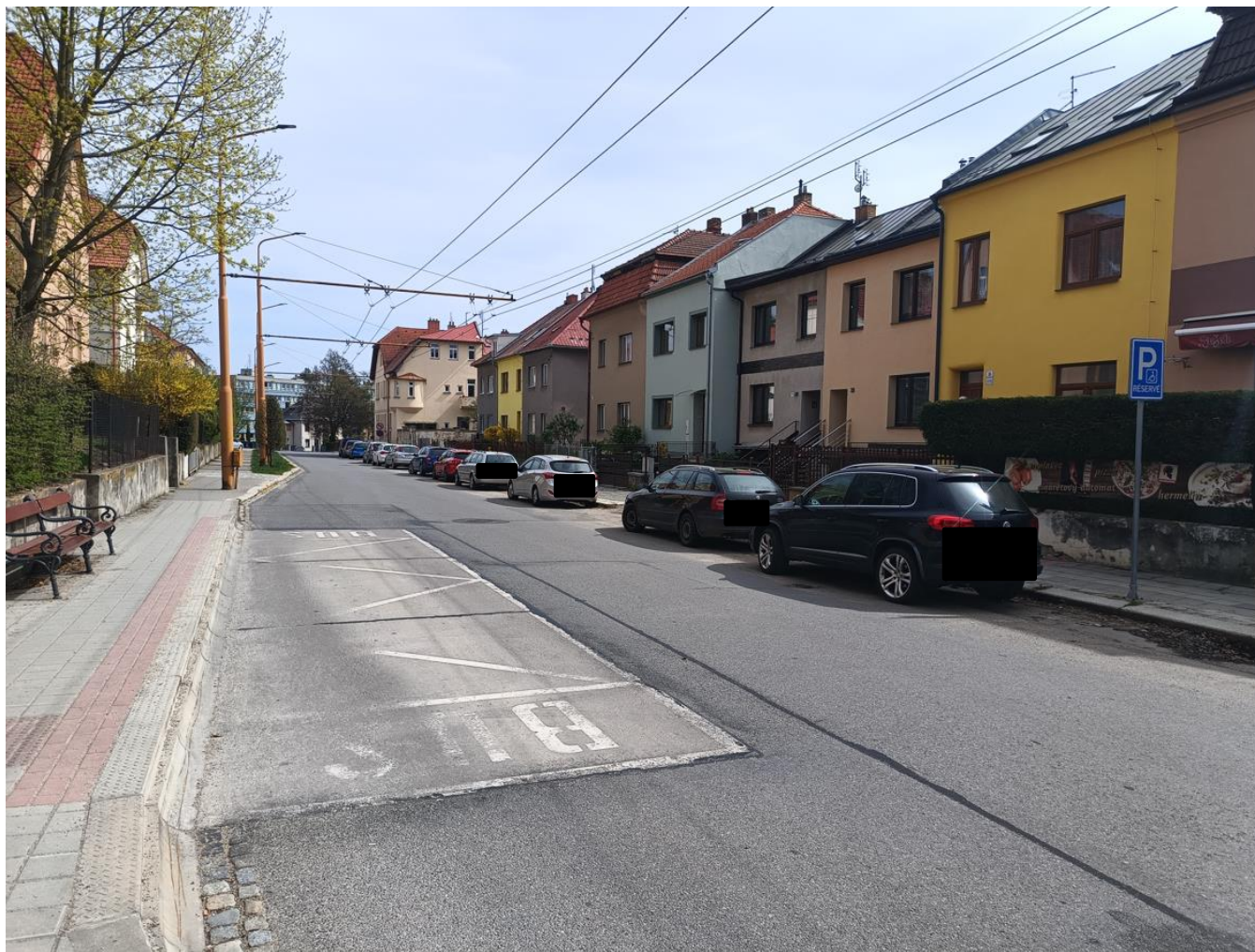
Pohled směrem k nové zastávce, která bude situována vpravo v místě stojících vozidel