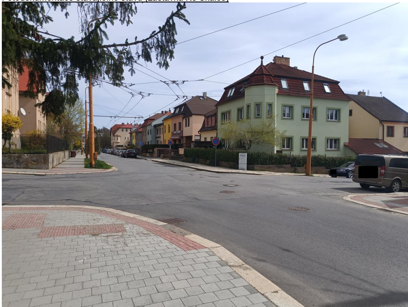
Pohled směrem k nové zastávce, která bude situována vpravo