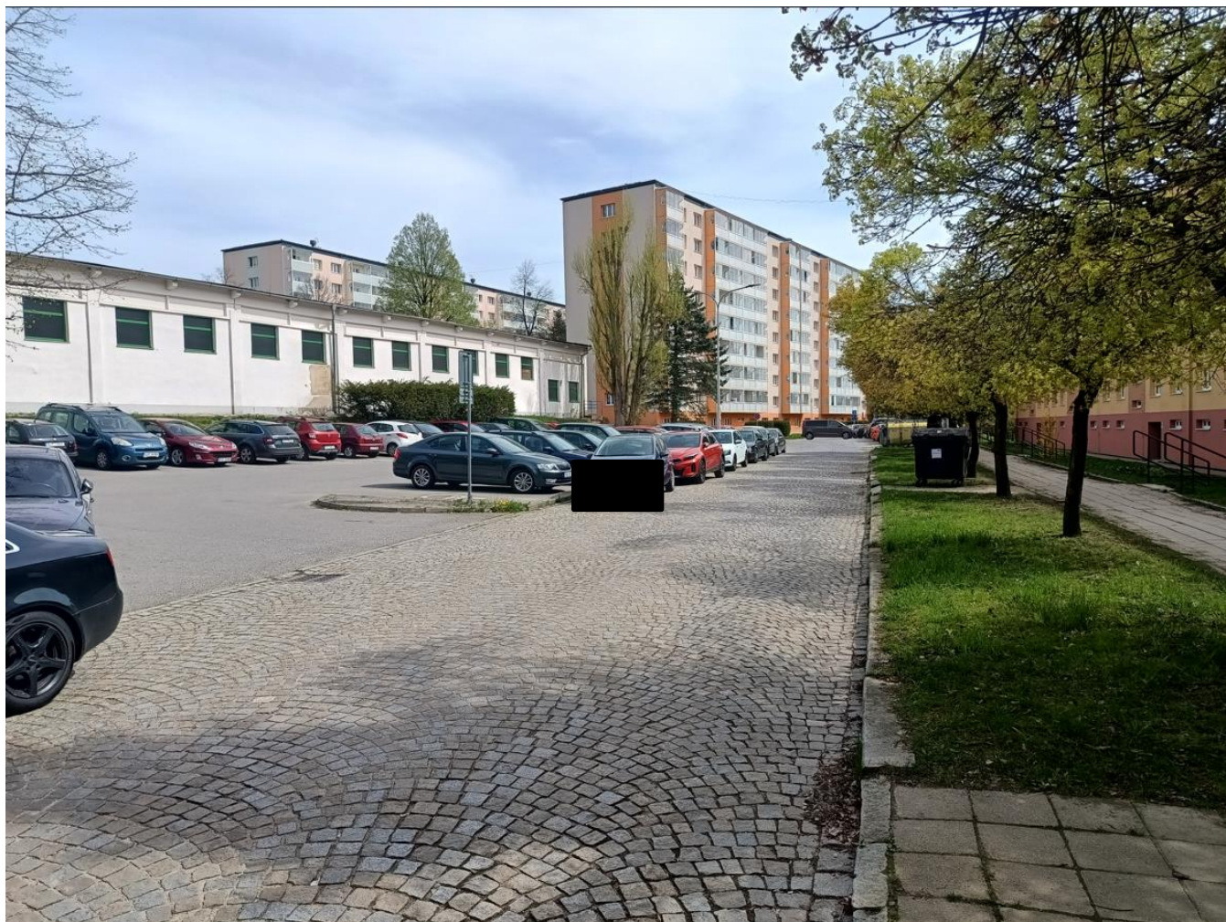
Pohled na budoucí severní nástupiště v místě stojících vozidel podél obruby vozovky