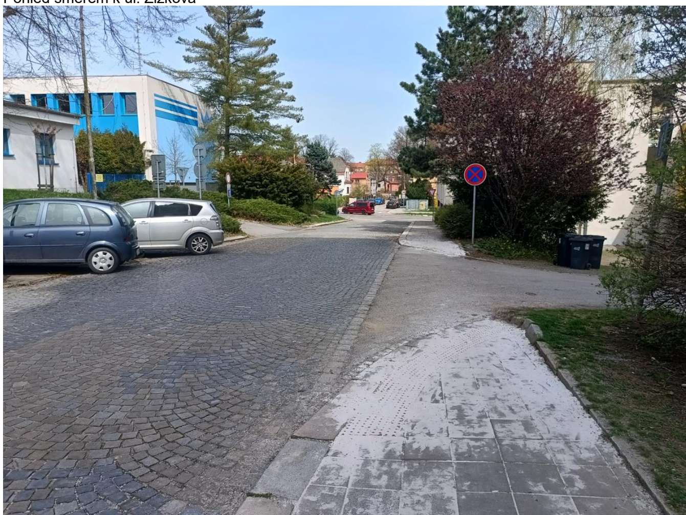
Pohled směrem k ul. Žižkova