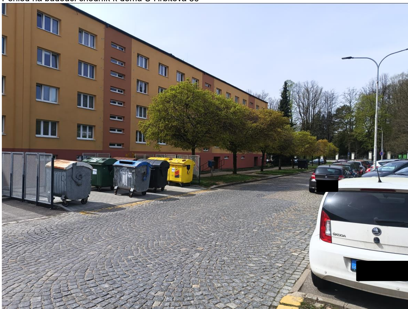
Prostor budoucího místa pro přecházení