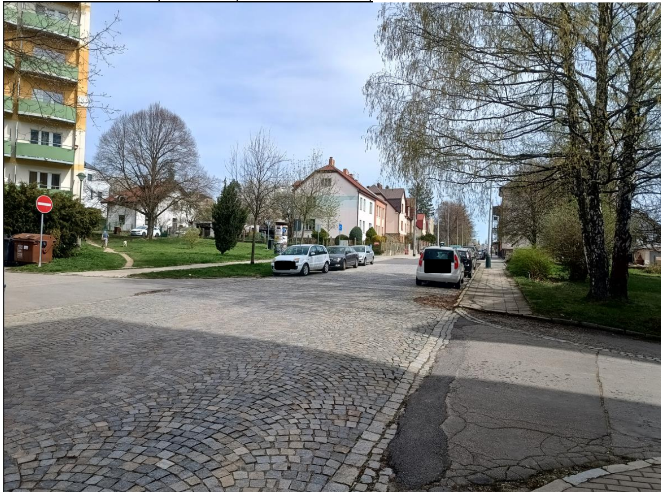
Pohled na prostor budoucích zastávek