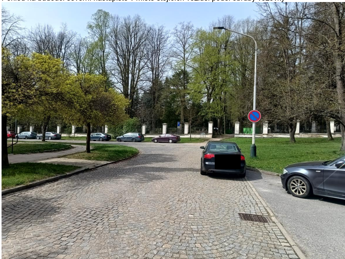
Pohled směrem ke vstupu do hřbitova, po pravé straně budoucí chodník v místě fialového vozidla budoucí stání pro ZTP.