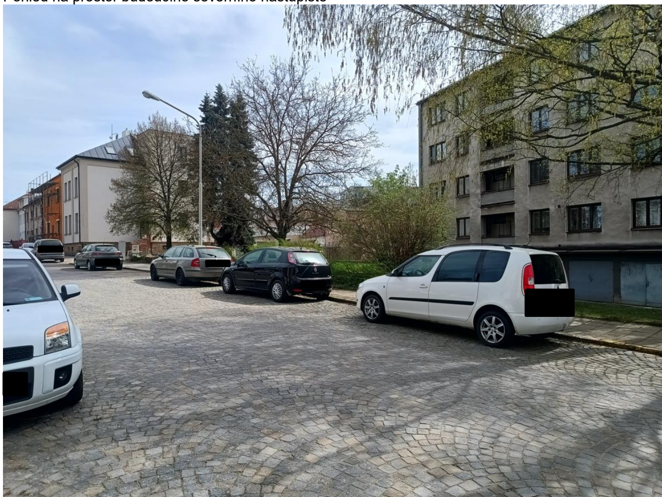
Pohled na prostor budoucího jižního nástupiště