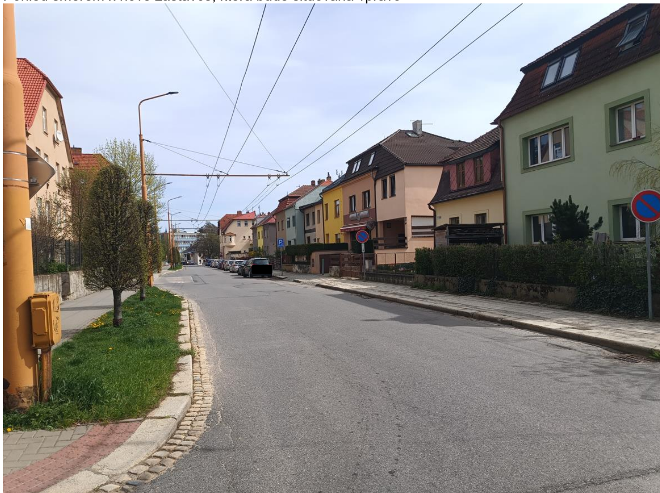
Pohled směrem k nové zastávce, která bude situována vpravo