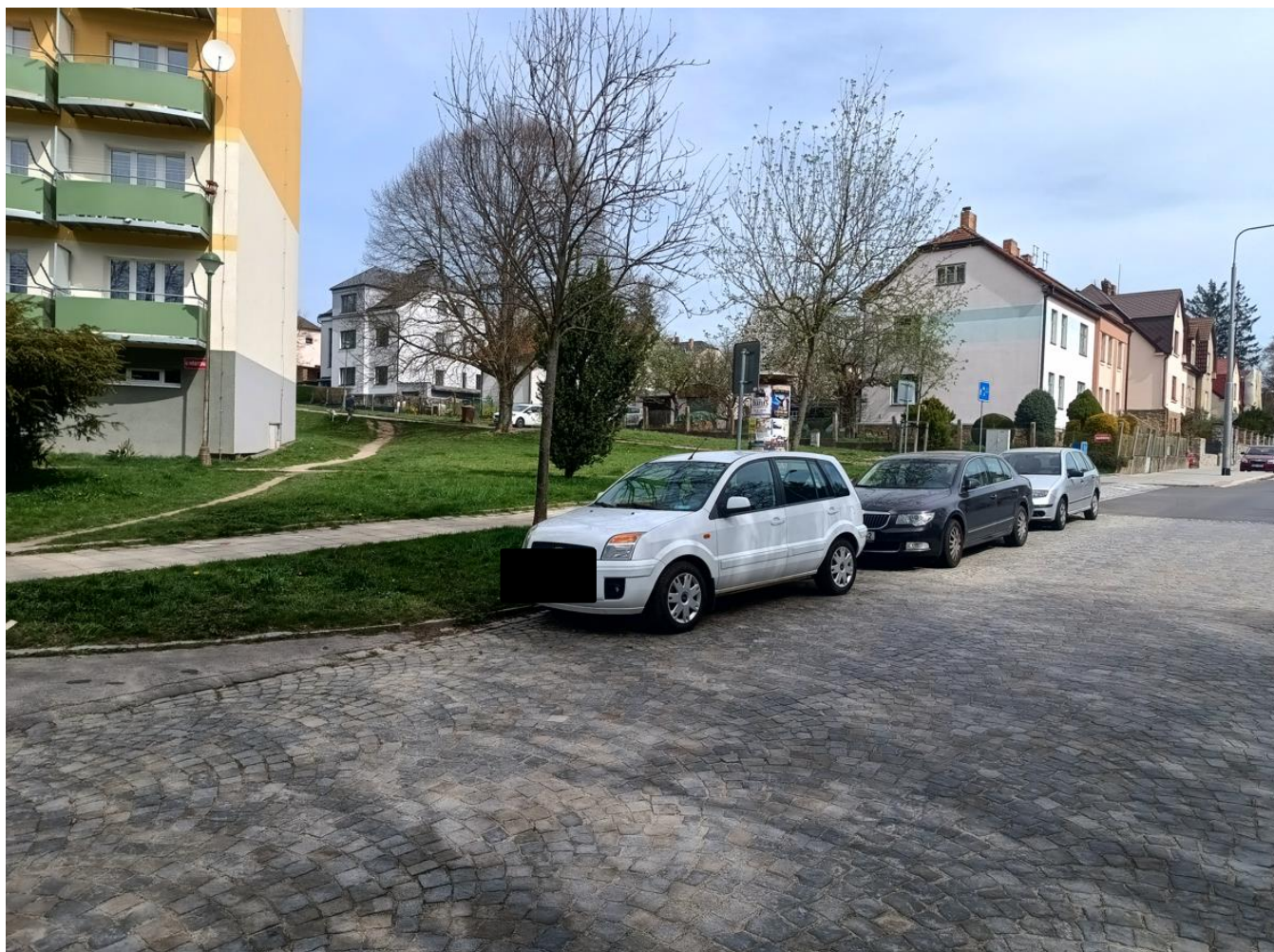
Pohled na prostor budoucího severního nástupiště