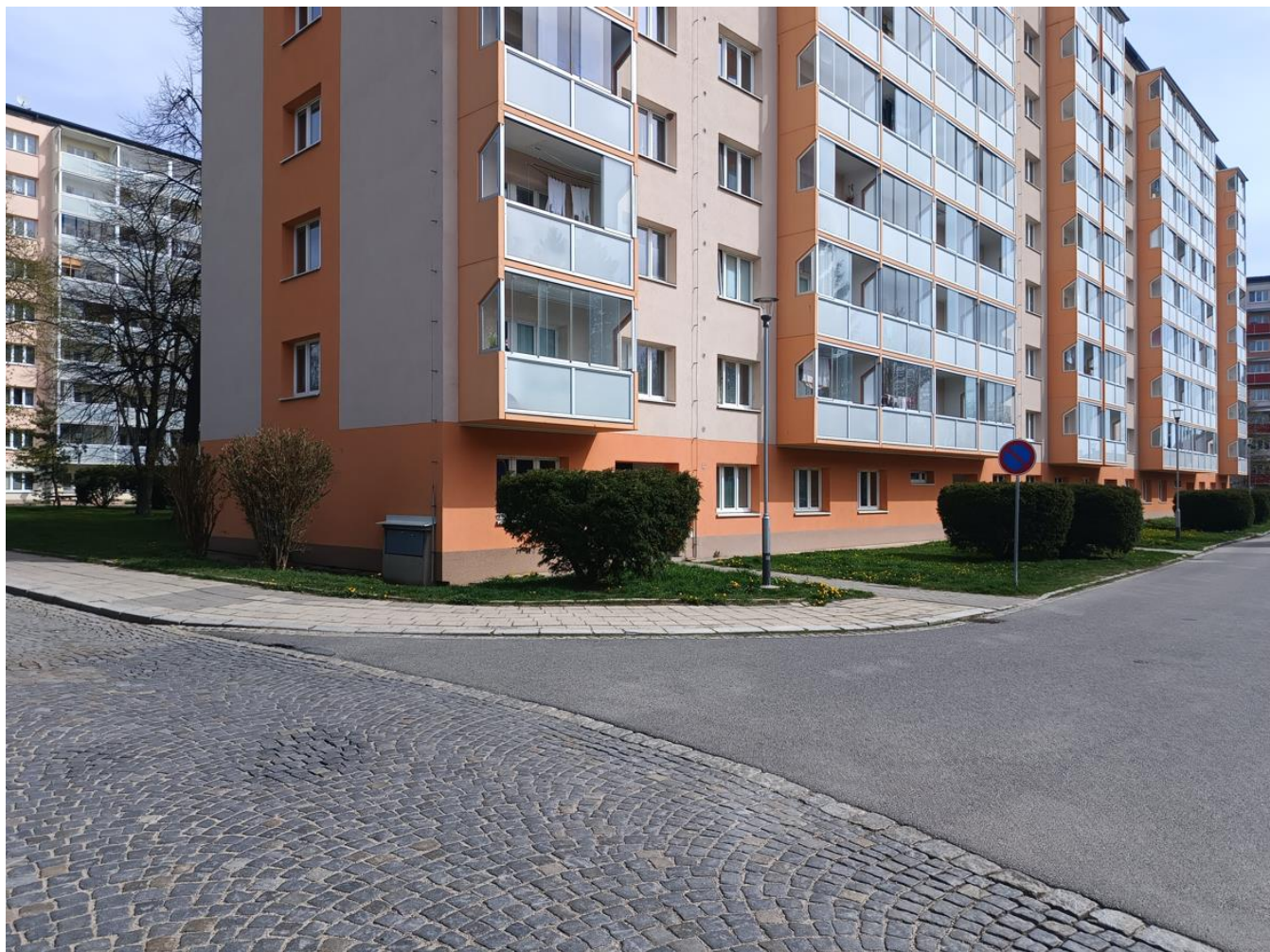
Pohled na budoucí chodník k domu U Hřbitova 56