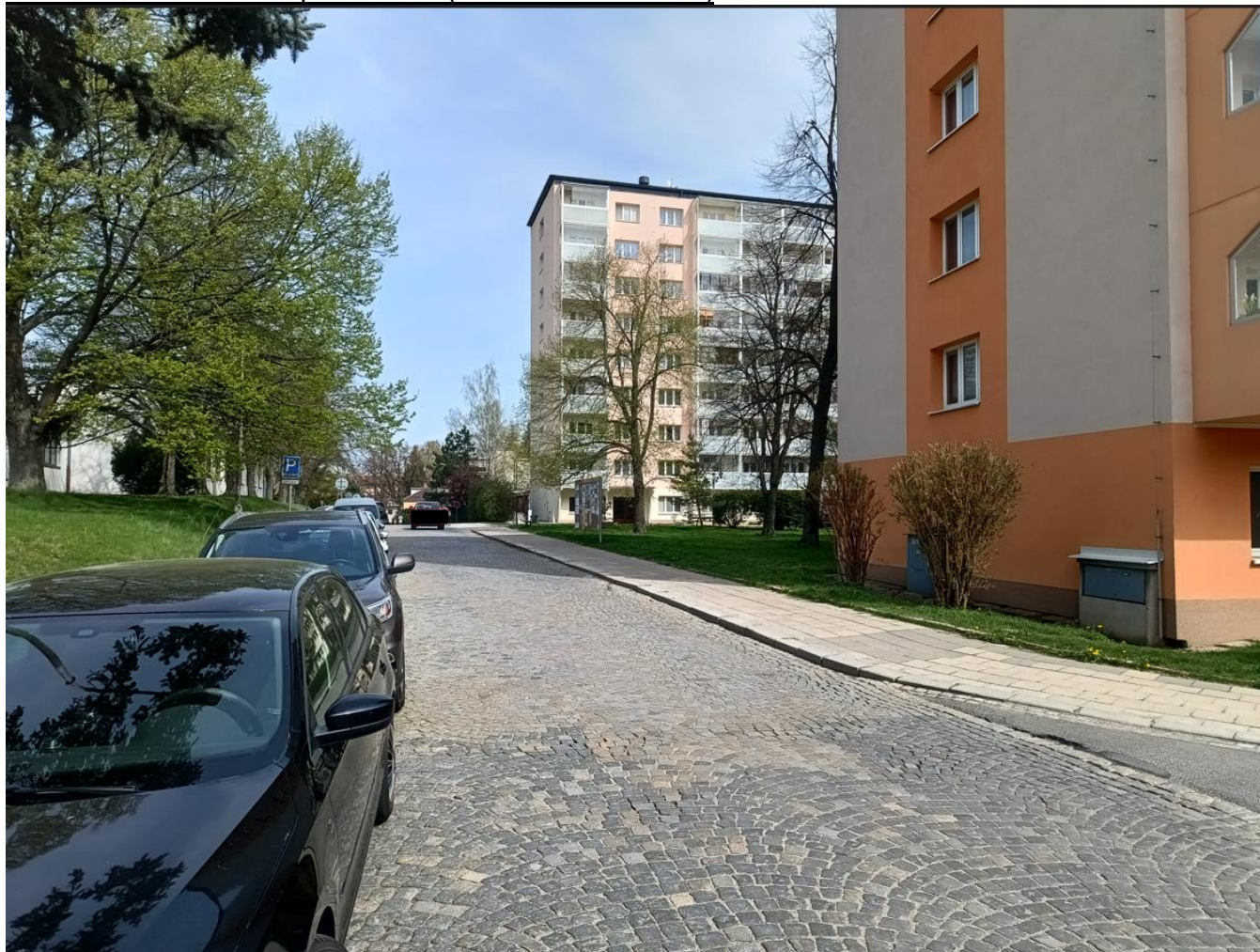
Pohled na prostor budoucího východního nástupiště