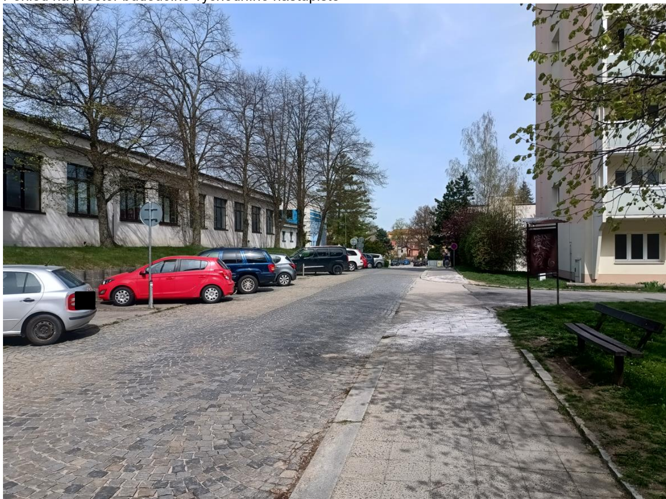
Pohled směrem k ul. Žižkova